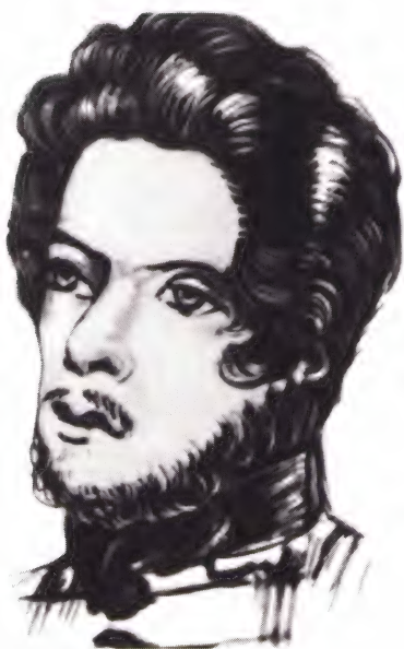
Карл Маркс — студент.