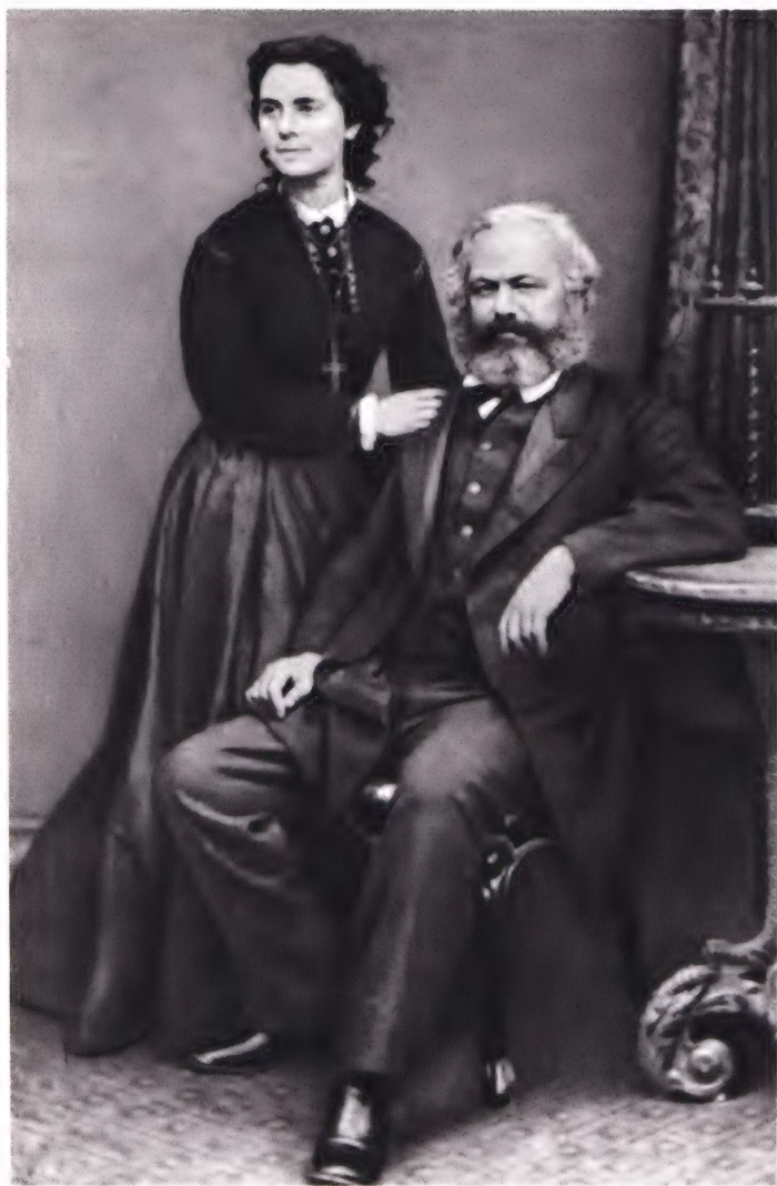
Карл Маркс с дочерью Женни (1869 г.).