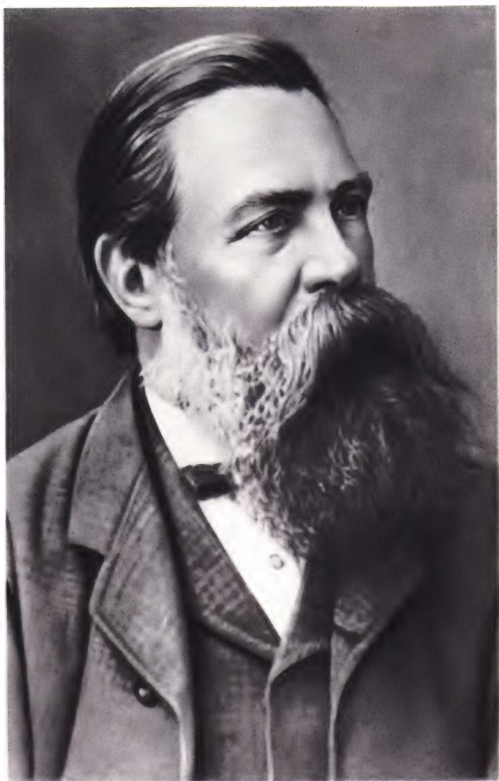
Энгельс в конце 70-х годов.