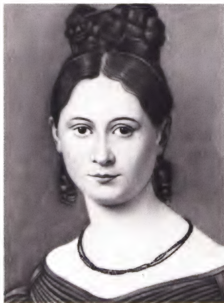
Женни фон Вестфален в 30-е годы.